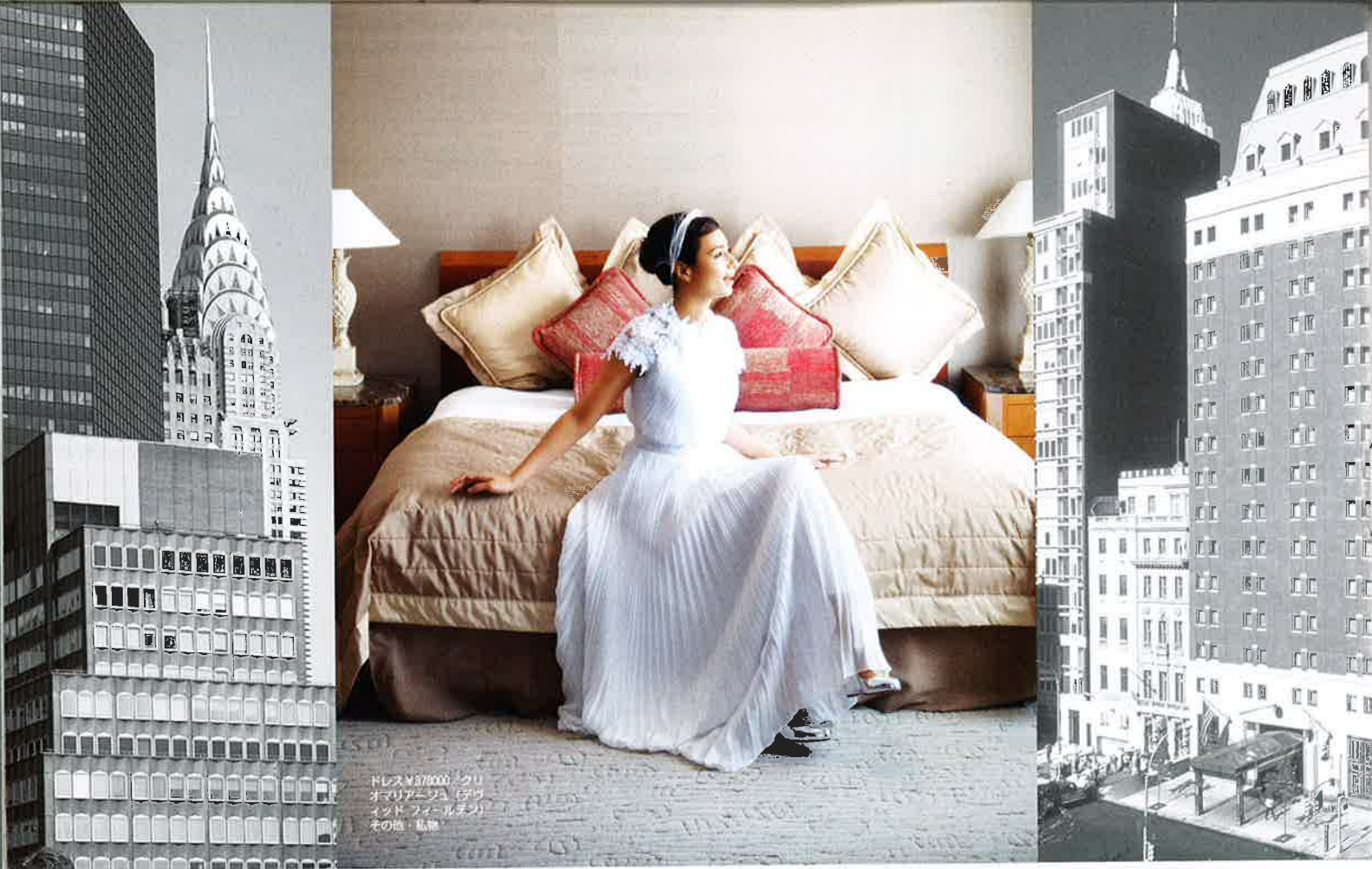
ドレス ¥578000 クリ オマリアエッジ (デワ インド フォールデン) その他 私服