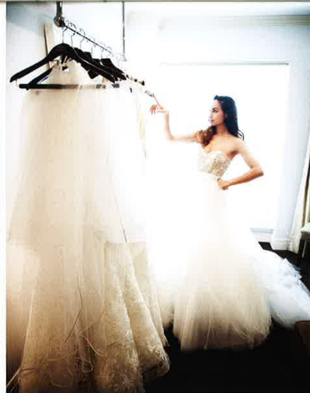
↑↑「オスカー・デ・ラ・レンタ」「ヴェラ・ウォン」「モニーク・ルイリエ」など、人気ブランドのサンプルがぎっしり！ 真由美が試着したドレスは、「バジリー・ミシュカ」のもので$8130（※オーダー）